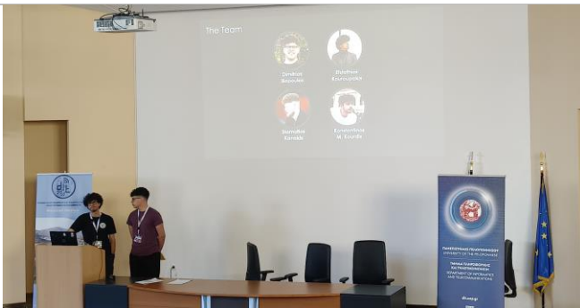
AgroSphere: An Integrated IoT System for Smart Sheep Monitoring and Management - Δημήτριος Ηλιόπουλος, Σταμάτης Κανάκης, Κωνσταντίνος Κουρδής, Ευστάθιος Κουρουπάκης